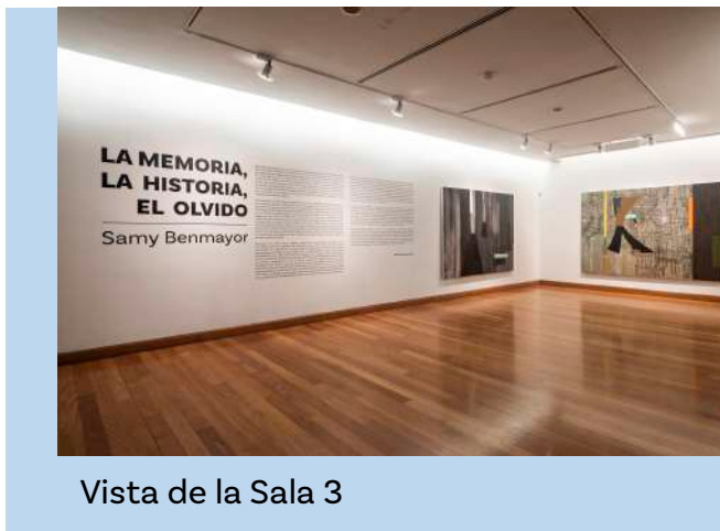
Vista de la Sala 3

Esta es la sala que inicia la exposición. En ella está el texto que explica la exposición con un gran título. Además, hay pinturas de gran y pequeño tamaño.