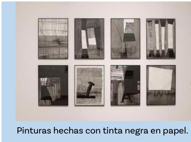
Pinturas hechas con tinta negra en papel.

En esta sala se exponen pinturas a tinta y fotografías de lugares intervenidos por el artista.