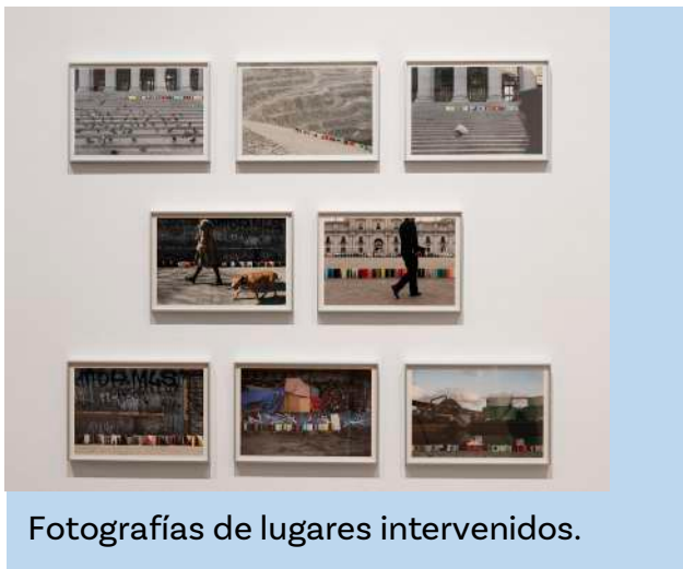
Fotografías de lugares intervenidos.

Lugares Intervenidos: lugares de la ciudad o paisajes donde el artista colocó pinturas hechas por él.